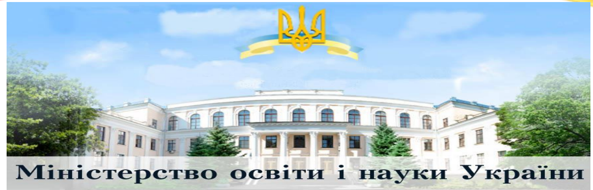
Міністерство освіти і науки України