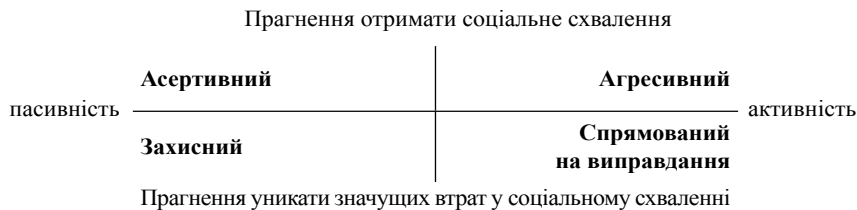
Рис. 1. Стили самопрезентації за А. Шутцем

У результаті було виділено чотири стилі самопрезентації: асертивний ( assertive ), агресивний ( offensive ), захисний ( protective ) та спрямований на виправдання ( defensive ) (рис. 1).