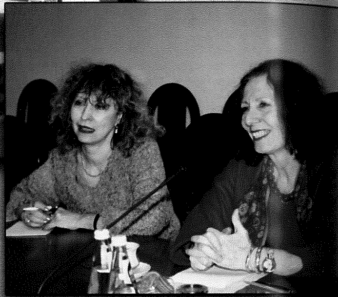
На знімку: пані Йоланда Брунетті (праворуч) з перекладачем.

З березня 2003 р. відбулась зустріч Генерального прокурора України Святослава Пісуну з Надзвичайним і Повноважним Послом Італійської Республіки пані Йоландою Брунетті.